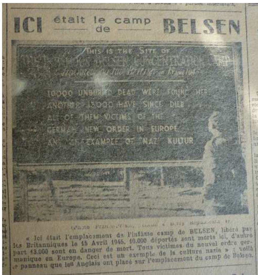
Le Berry Républicain du 9 et 10 juin 1945. AD 18 – 204 PER 2