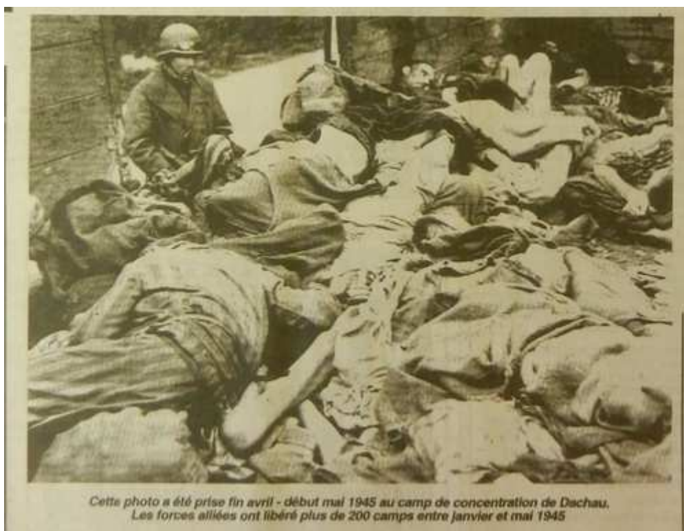
Cette photo a été prise fin avril - début mai 1945 au camp de concentration de Dachau. Les forces alliées ont libéré plus de 200 camps entre janvier et mai 1945