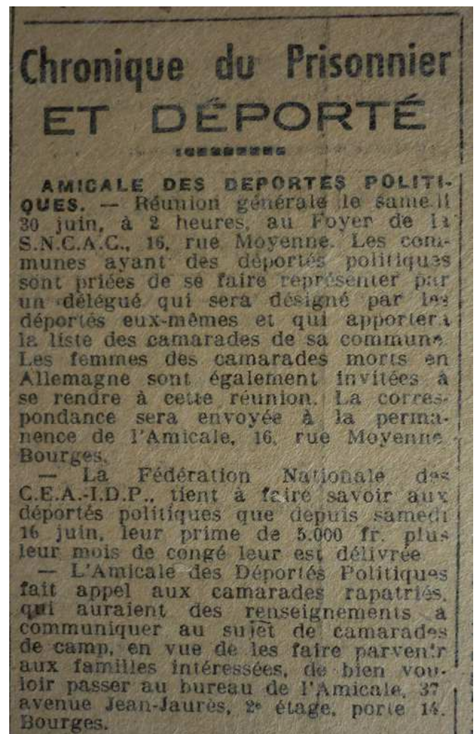
Le Berry Républicain du 20.06.1945 AD 18 – 204 PER 2