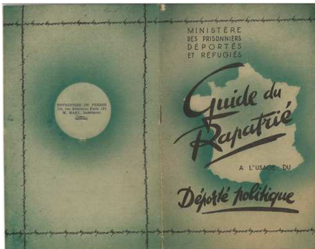
Guide destiné à aider à la réinsertion des déportés.