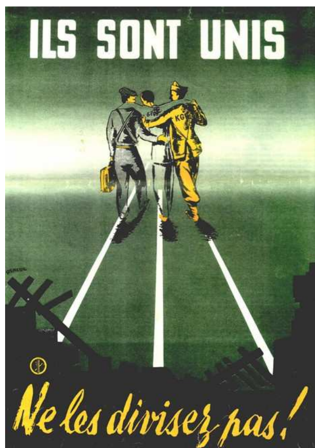
Le retour des absents. Affiche. Musée de la Résistance et de la Déportation du Cher.

De plus, j'avais l'impression d'être assis entre deux chaises : appartenant aux deux catégories, je pensais que ma place n'était nulle part. Si, au début du rapatriement, on ne faisait aucune distinction entre les prisonniers de guerre, les requis du STO et surtout les survivants des camps, maintenant, des murs s'étaient dressés entre les catégories. Avec raison. On savait bien que la vie dans les camps de concentration n'était pas comparable à celle des prisonniers de guerre et des requis du STO. Déjà l'administration faisait une distinction entre déporté politique et déporté résistant. Quant aux jeunes du STO, le titre de déporté du travail ne leur fut pas reconnu, mais celui de « personne contrainte au travail en pays ennemi ».