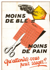
Document 4 AD18-27FI21

Document 1 : Qu'est-ce qui accompagne la carte ? Document 2 : À quelle fréquence (rythme) sont-ils distribués ?