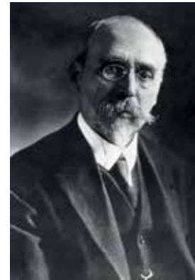
< Ferdinand Buisson

Réservation obligatoire au 02 48 55 82 60