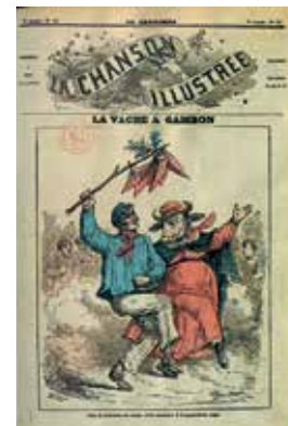
< Couverture de La Chanson illustrée, 1870.

Lecture-théâtralisée de Michel Pinglaut pour le bicentenaire de Gambon.