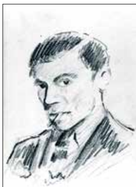
< Jean Moulin, autoportrait, 1928, crayon sur papier, Musée des Beaux-Arts de Béziers

Réservation obligatoire au 02 48 55 82 60