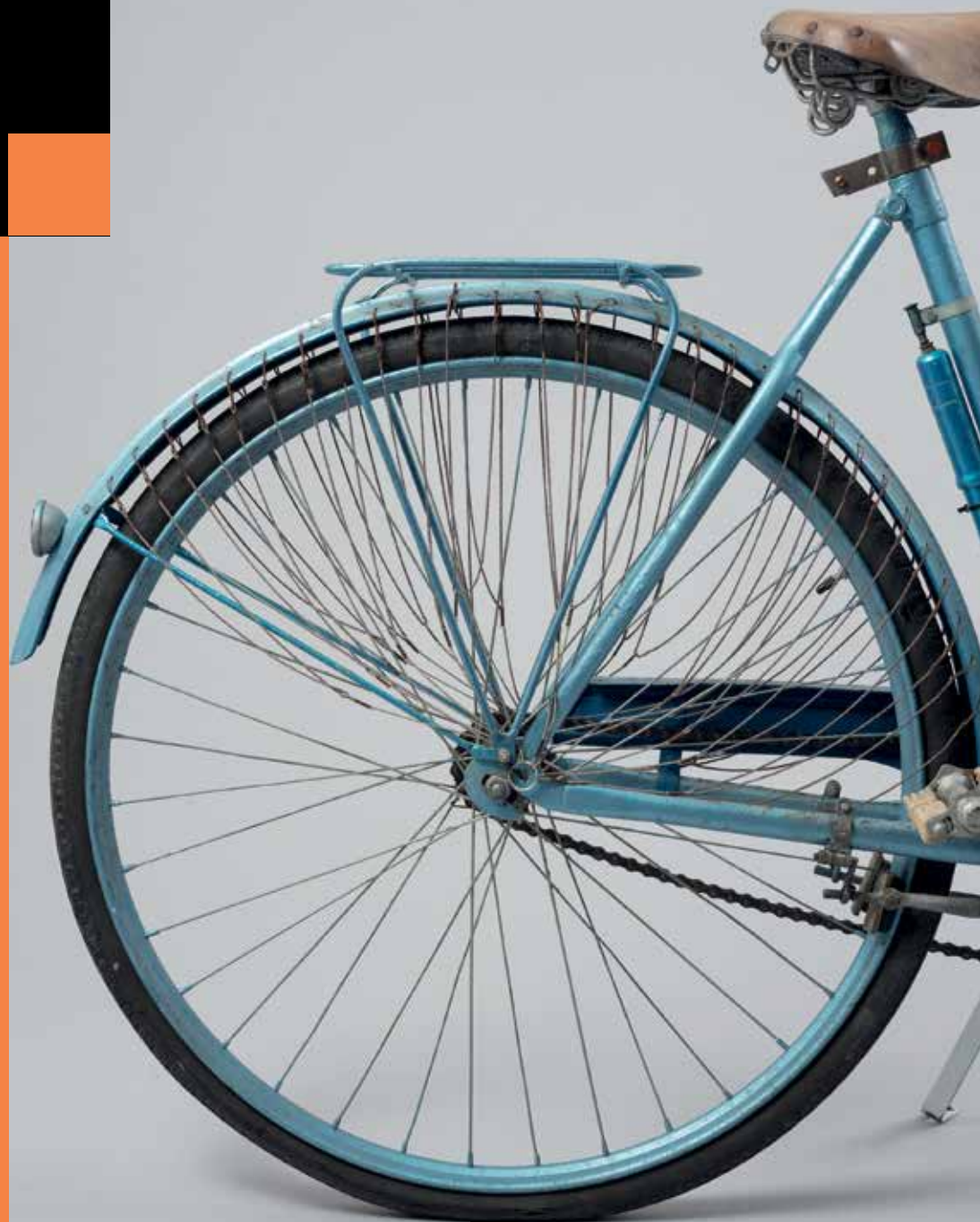
Roue de bicyclette de marque Peugeot, années 1940. Musée de la Résistance et de la Déportation du Cher >