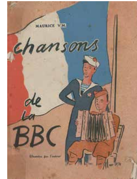
< Chansons de la BBC, pour Maurice Van Moppès, Londres, 1943, AD du Cher, 140 J1.

Le samedi 17 octobre 2020, le musée de la Résistance et de la Déportation du Cher fête ses 10 ans ! Pour cette occasion, le public découvrira les grands événements qui ont marqué le musée à travers une exposition rétrospective inédite et pourra vivre cet anniversaire de manière festive avec l'association « Chorallogny » qui proposera un récital de chansons du Front populaire à la Libération et l'association Rock'n Swing Attitude pour une démonstration de « lindy up » !